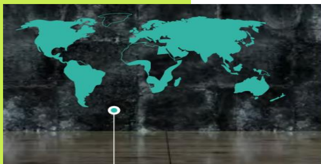
Baker Tilly International en chiffres

Baker Tilly STREGO dispose d'un département International dédié au business international, composé de collaborateurs multilingues ayant de nombreuses années d'expérience. Leur expertise dans leur domaine d'activité respectif leur confère toute légitimité pour conseiller et accompagner les entreprises étrangères souhaitant s'implanter en France et inversement.